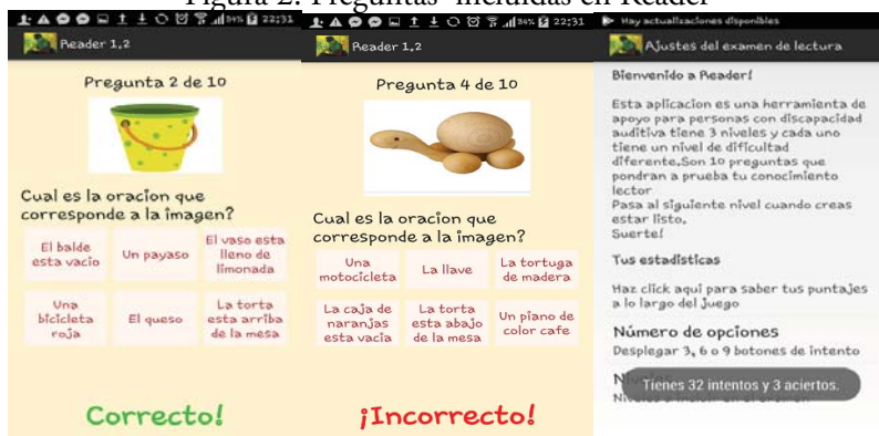
Figura 2. Preguntas incluidas en Reader

Ejemplos de preguntas que se realizan en el juego, y la introducción al mismo